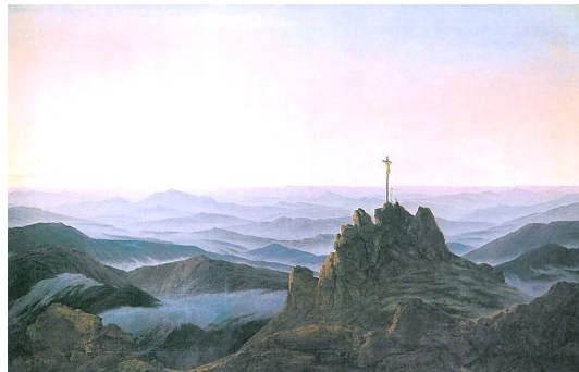
Caspar David Friedrich - Manhã

Título Original em Italiano Ernesto Bozzano - Dei fenomeni di "bilocazione" Tipografia Dante, Città della Pieve (1934)