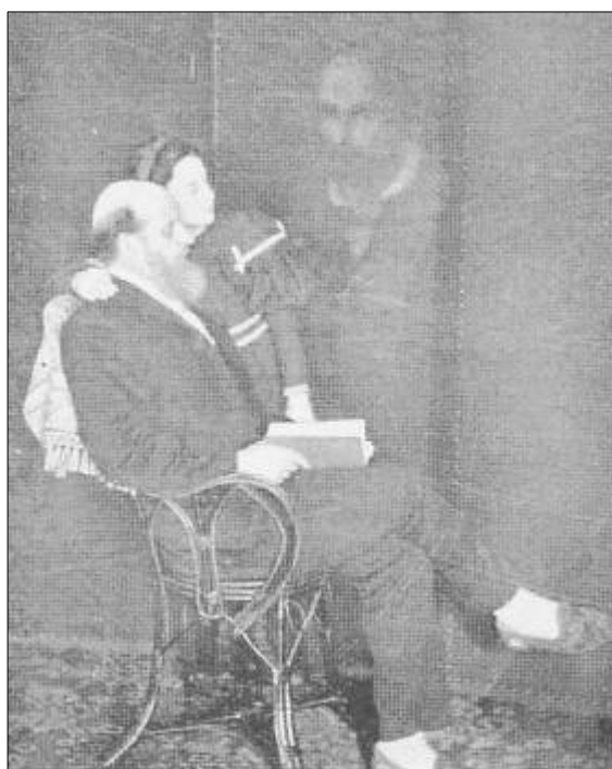
Fotografia obtida às 15 horas do dia 14-02-1897. Supõe-se seja a de Philipp Melanchthon