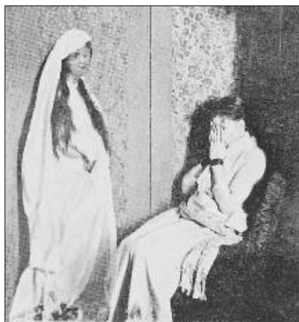
A médium e o Espírito materializado fotografados juntos. A primeira protege os olhos da claridade do magnésio (segundo uma fotografia, junho, 1890).

Mais tarde descobri que o meu estado não era somente o da indiferença ou da inércia; eu estava completamente sem energia e, se procurasse fazer um grande esforço, obrigaria invariavelmente as formas materializadas a se recolherem ao gabinete, privadas do poder de sustentarem-se; esse fato, porém, como muitos outros, não podia ser aprendido sem o sofrimento.