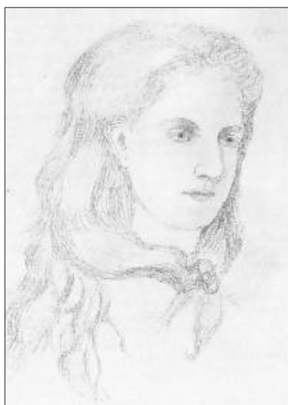
Um dos retratos desenhados na obscuridade, em cuja consecução foram gastos aproximadamente 30 segundos. Esses retratos não foram procurados.

Enquanto me ocupava em retratar por esse meio os habitantes do outro mundo, pensei na imperfeição dos meus trabalhos e deliberei passar uma ou duas horas por dia a desenhar, a fim de fazer progredir o meu pequeno talento. Trabalhei nisso seriamente por muitos meses; mas, coisa estranha, à medida que eu aperfeiçoava o meu trabalho, diminuía a minha faculdade de distinguir as formas luminosas. Finalmente, tornou-se para mim uma raridade a obtenção de qualquer retrato, e esse trabalho pareceu afetar os meus nervos, produzindo-me violenta dor de cabeça, que continuava ainda por um ou dois dias depois da sessão. Contrariada, fui, portanto, obrigada a abandonar os meus ensaios. Em algumas ocasiões esse dom foi passageiramente restituído, podendo eu durante semanas retratar os Espíritos; mas depois sentia-me exausta por dias inteiros. Por isso, ainda que estivesse sempre nas sessões munida do material necessário, não tinha a idéia de servir-me dele.