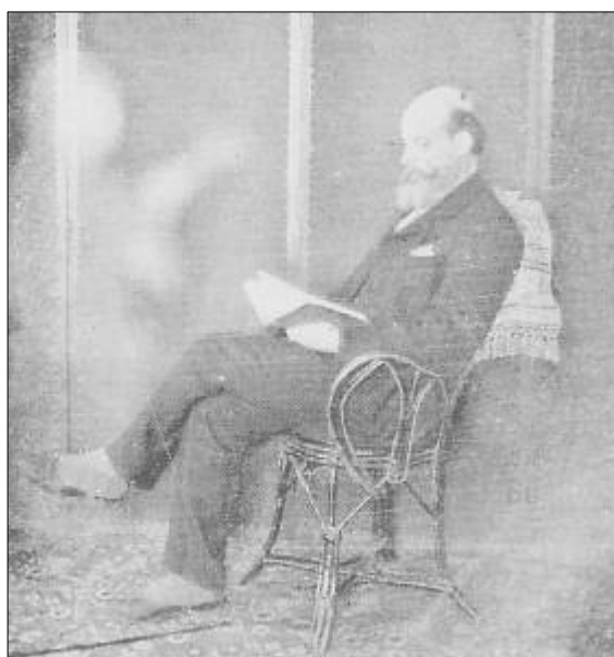
Uma das primeiras formas-sombras. (Fotografada às 15 horas do dia 08-02-1897).

Tínhamos instalado o aparelho fotográfico em um salão de ângulos cortados. Nesses pontos não podíamos fazer alteração. Tínhamos anteriormente empregado como fundo um biombo de cor marrom-escuro; não o podíamos substituir, mas cobrimo-lo com um pano preto, a fim de tornar mais visível qualquer forma branca que se apresentasse. Éramos geralmente cinco a tomar parte nessas experiências: o dono da casa, sua senhora, suas duas filhas e eu. Quando o relógio dava três horas, todos entrávamos no salão. Um de nós colocava o biombo na posição exigida; outro ocupava-se com o aparelho, dirigindo a objetiva para outra pessoa que, a título de ensaio, se assentava diante do biombo. Enfim, uma quarta pessoa regulava as venezianas, de modo a produzir-se o melhor efeito de luz. Esperávamos que o aparelho ficasse pronto e que os preparativos do magnésio fossem terminados; e depois de contarmos em silêncio 30 segundos, expúnhamos a chapa durante 5 segundos. Acendíamos o magnésio. Às vezes tirávamos três ou quatro provas, outras vezes seis ou sete. Elas eram imediatamente levadas ao gabinete escuro e reveladas.