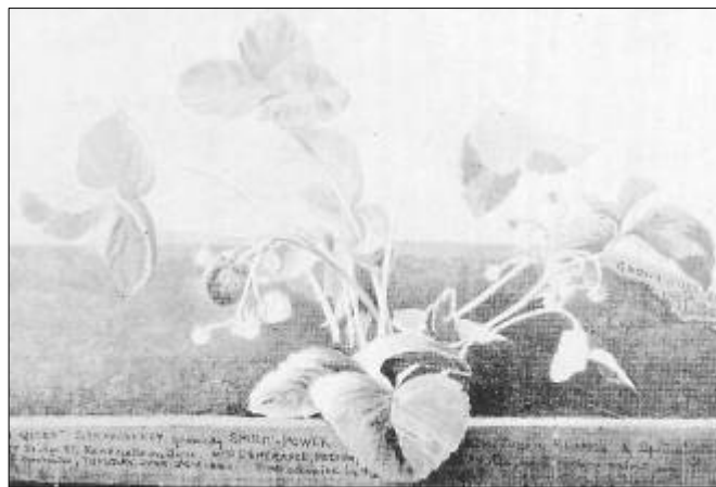
Morangueiro carregado de flores e frutos, produzido em uma sessão. Os morangos maduros foram distribuídos entre os assistentes.

Se esse sentimento de ansiedade tomava realmente a forma de um pensamento, descobria que ele sempre forçava Iolanda a entrar no gabinete, contrariada e, às vezes, com uma petulância infantil. Isso demonstrou que o meu pensamento exercia uma influência dominadora sobre os seus atos e que ela somente vinha a mim quando não mais se sustentava a si mesma.