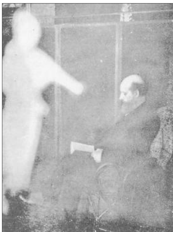
Uma forma-sombra fotografada às 15 horas do dia 09-02-1897.

Trabalhamos assim durante cerca de 15 dias, sempre discutindo seriamente a respeito dos novos processos que devíamos empregar para obter-se melhor resultado.