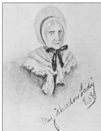
A mulher fantasma

Muitas vezes perguntei a mim mesma como a velha dama suportava essa invasão, pois, por meu lado, ressentia-me com essas investidas nos domínios dos meus amigos fantasmas. Parecia-me sempre que só eles eram os habitantes legítimos das câmaras desocupadas.