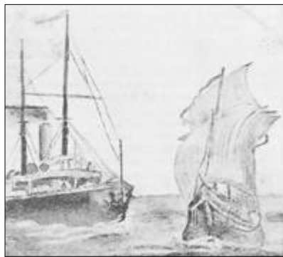
A nau fantasma

Vi isso num relancear de olhos, antes de esconder o meu rosto. Tudo pareceu tornar-se negro e meu coração cessou de pulsar, enquanto eu esperava o inevitável choque. Oh! que agonia nesses momentos! Nenhum tempo apagará da minha memória os pensamentos que me assaltavam o cérebro, enquanto eu esperava o encontro das duas embarcações. Pareceu-me que esse momento teve a duração de uma vida inteira.