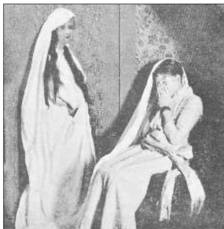
A médium e o Espírito materializado fotografados juntos, alguns segundos após a prova precedente. Este cobrira a médium com um pano que a luz parecia dissolver.