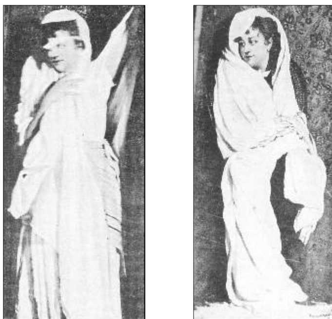
Leila, tal como apareceu parcialmente materializada, em 13-03-1890. (Fotografias obtidas com luz de magnésio)

As condições de admissão nas sessões tinham sido tais que as nossas experiências deviam ser consideradas como restritamente privadas, nada se podendo publicar a esse respeito sem a minha autorização. Como os outros, o fotógrafo tinha aceitado essa cláusula. Li rapidamente o manuscrito e copiei-o; risquei o meu nome em todos os lugares onde se achava escrito e enviei o original ao seu destinatário, satisfeita com a sua imparcialidade sobre o assunto e as suas boas qualidades de observador. Nesse manuscrito ele exprimia-se como quem tivesse adquirido certas convicções, apesar de conservar algumas dúvidas; a esse respeito, porém, nenhuma objeção me cabia fazer, pois eu adotava as mesmas opiniões. Um homem que não tem dúvidas a vencer em suas investigações não pode ser um bom aliado. Quando, entretanto, o artigo apareceu alguns dias depois, sem o meu consentimento nem o dos assistentes, estava tão mutilado, tão entremeado de acusações e calúnias, que fiquei quase paralisada de horror, recusando crer em meus sentidos,